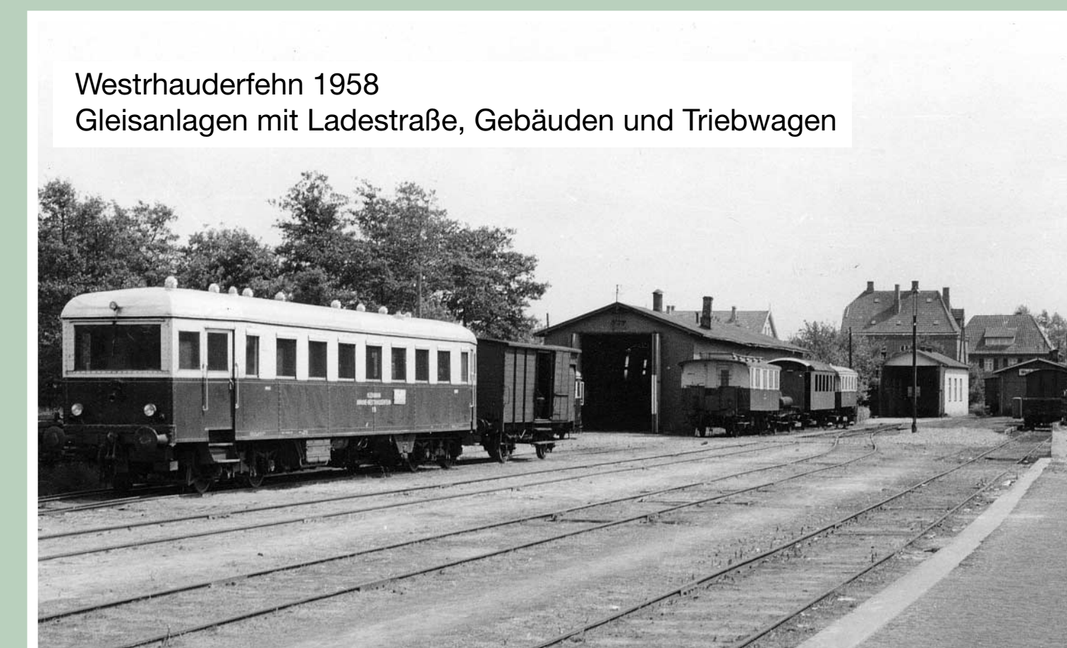
Westrhauderfehn 1958 Gleisanlagen mit Ladestraße, Gebäuden und Triebwagen