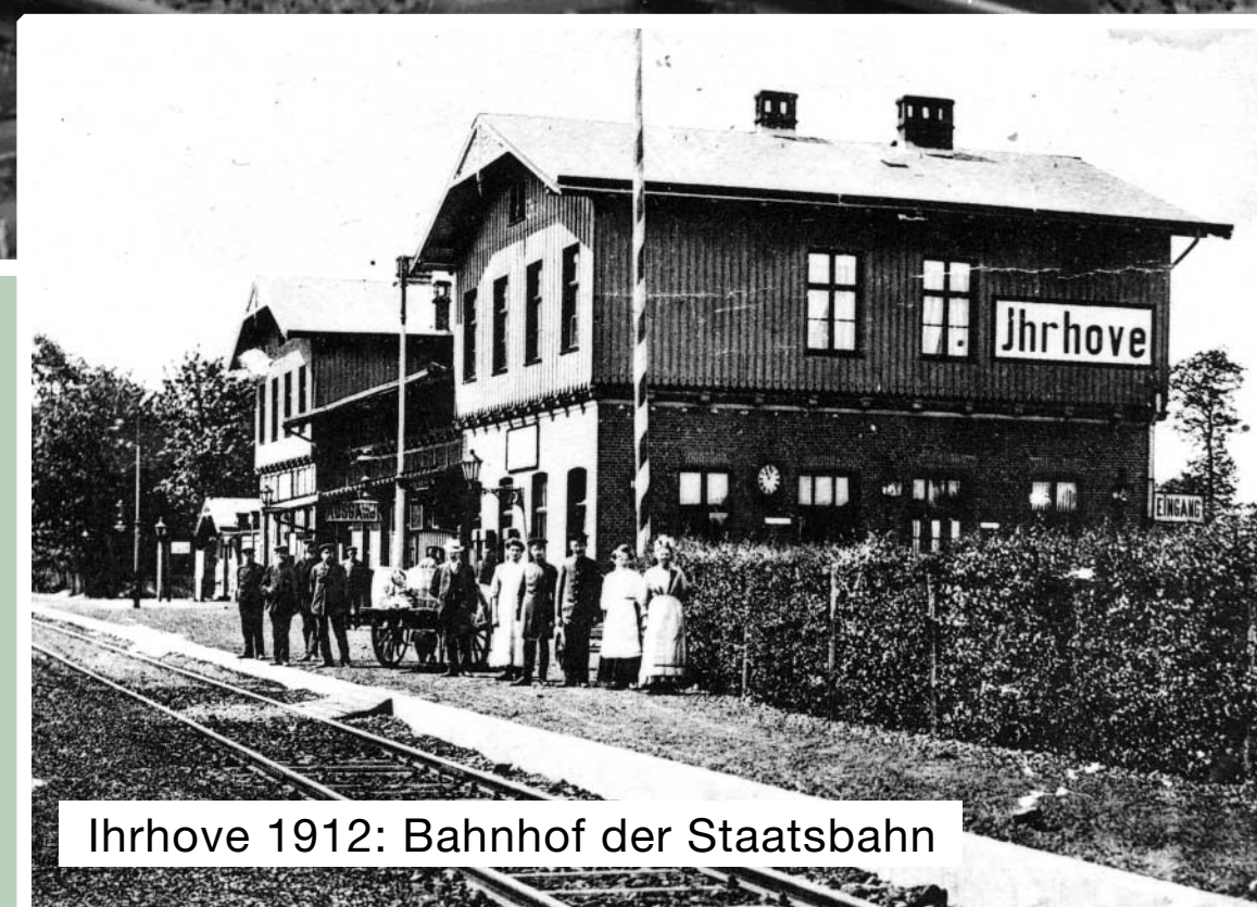
Ihrhove 1912: Bahnhof der Staatsbahn