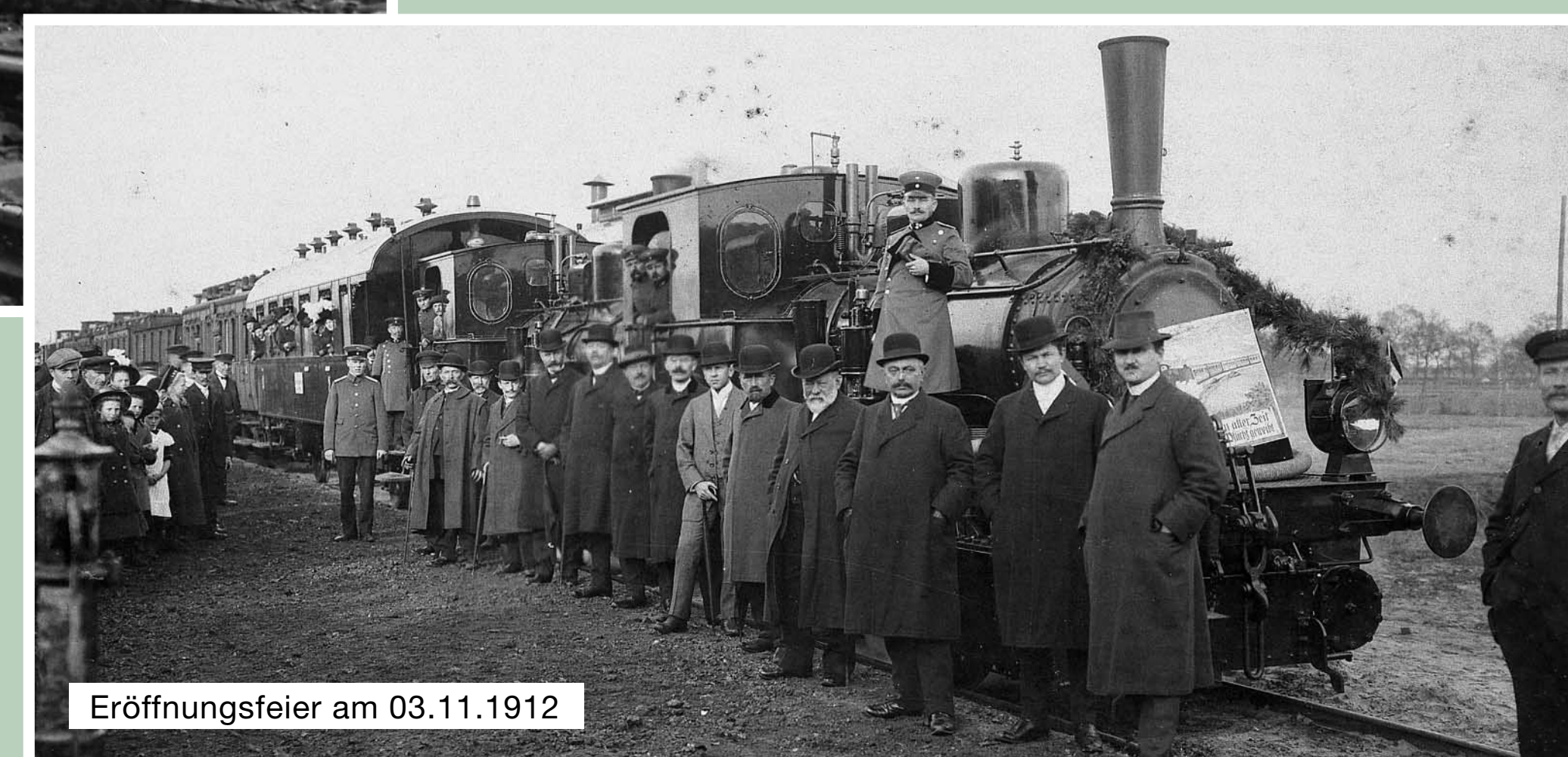
Eröffnungsfeier am 03.11.1912

Die Schienenstrecke von Westrhauderfehn bis zur Ladestraße in Ihrhove wurde 1975 abgebaut, das Reststück in Ihrhove 1979. Die Trasse wird seit 1979 als Ostfrieslandwanderweg von den Gemeinden Rhauderfehn und Westoverledingen unterhalten. Besonders von Radwanderer wird diese Strecke heute gerne genutzt.