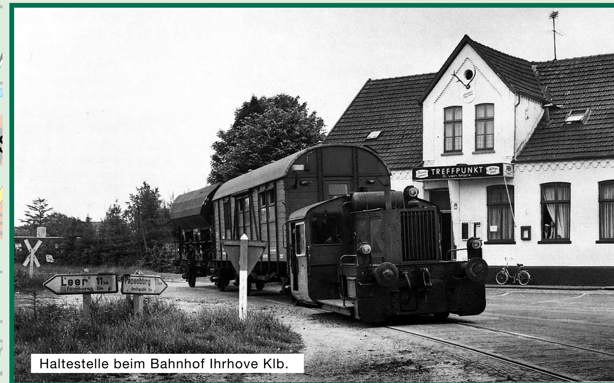
Haltestelle beim Bahnhof Ihrhove Klb.