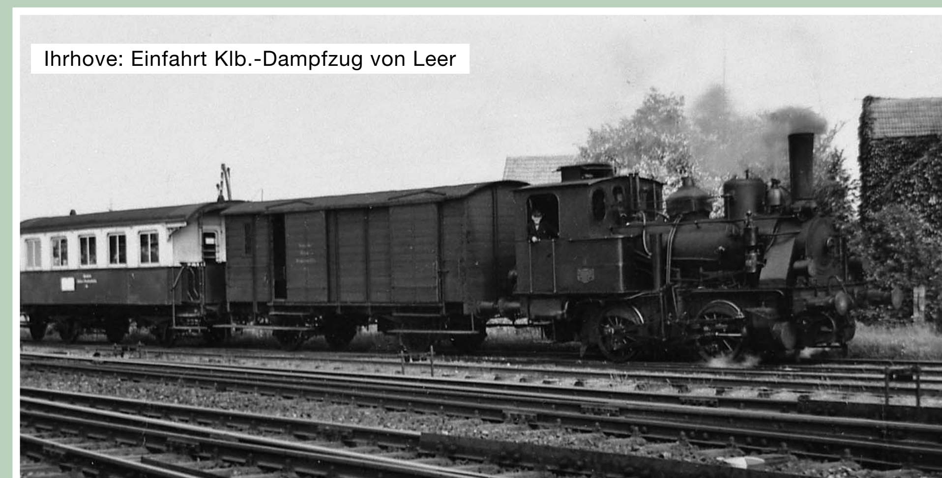
Ihrhove: Einfahrt Klb.-Dampfzug von Leer

Der Schienengüterverkehr wurde mit einer Diesellok bis Ende 1974 durchgeführt, nach Ihrhove-Ost noch bis 1979.